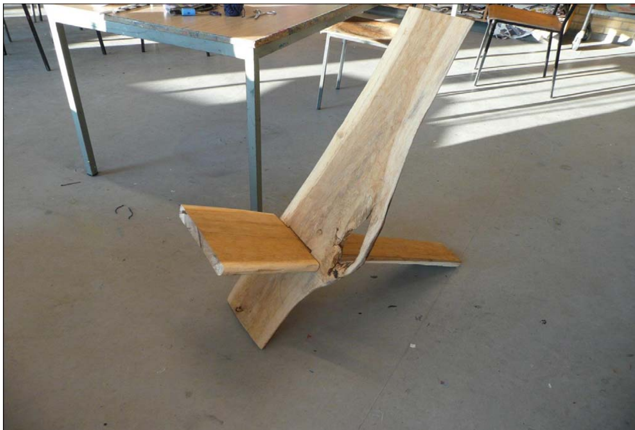
Elses vikingestol inden den er helt færdig.

Jeg har bestemt lyst til at tage børnebørnene med, for de er vilde med at "lave noget". Og så kan forældrene jo lige få lidt børnefri.