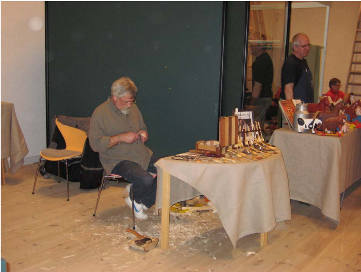
Håndværkerdag Silkeborg museum 2010

Medbring gerne eksempler på dit håndarbejde til en lille udstilling.