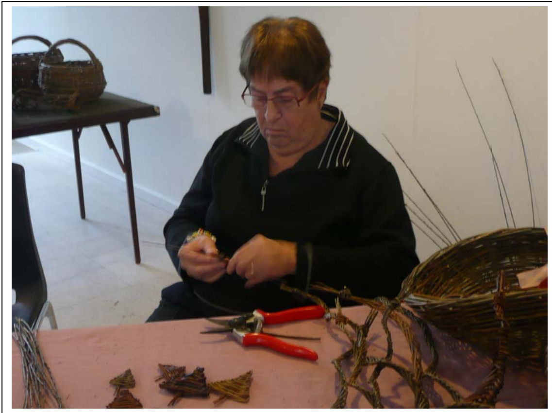
Husflidsdag på Gl. Estrup 2010 Pileflet

Bladet udkommer på nettet den 01. august 2011 på www.aarhusamt.husflid.dk