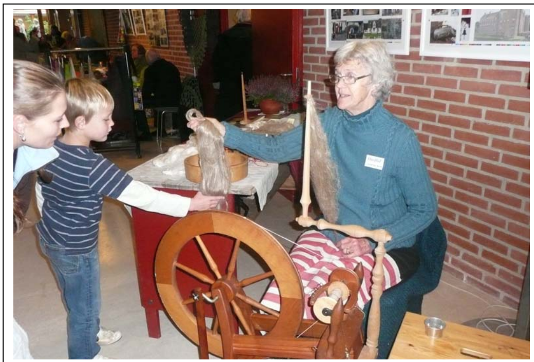
Husflidsdag på Gl. Estrup 2010