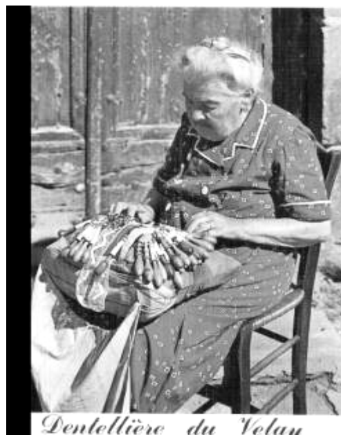
Dentellière du Velau

I Le Puy så vi kniplinger i lange baner. Et knipleremuseum hvor der også var kniplerskole for byens piger og drenge. I samme gade var der flere forretninger, hvor de solgte kniplinger, både som beklædning, men også som duge, puder, billeder m.m. Uden for forretningerne sad både kvinder og mænd og kniplede. Kendetegnende for Le Puy kniplinger skulle være bladene (galslagene). Kniplingerne var dog slet ikke så pæne, som dem vi ser i Danmark. Kniplingerne var meget grove og åbne. I Le Puy