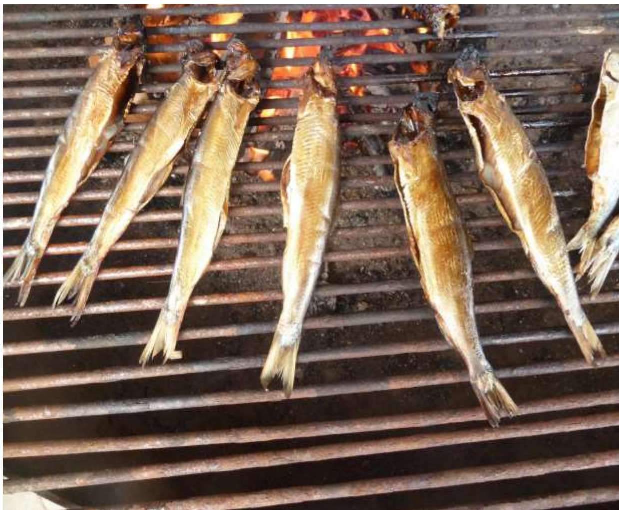
Lækre røgede sild på Fjordcenteret i Voer.