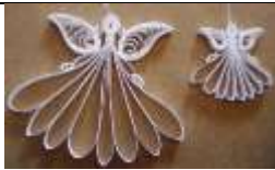
Billede fra Dommerby Papir.

Jeg medbringer alle materialer. Værktøjet kan lånes denne aften, men det kan også købes.