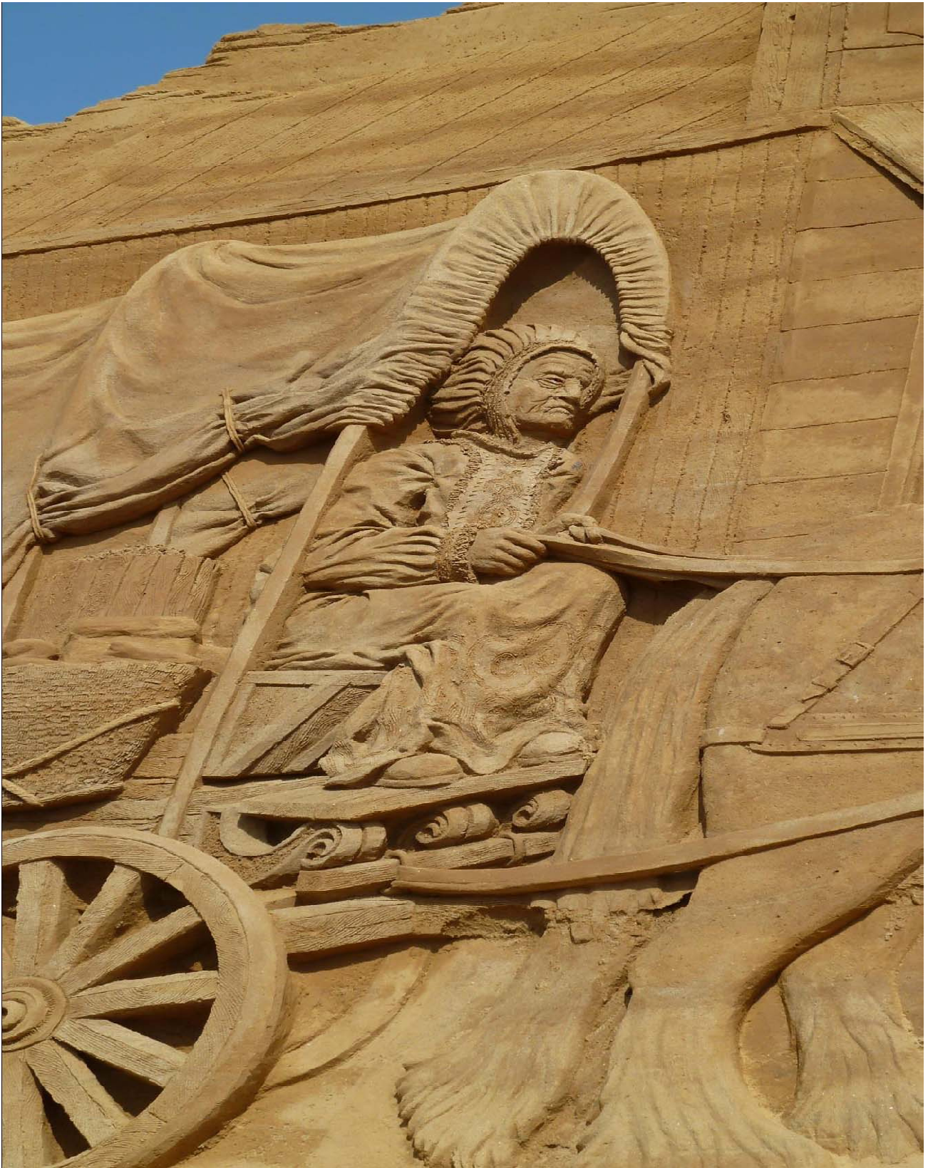
The Wild West Sandskulpturfestival i Søndervig 2013.