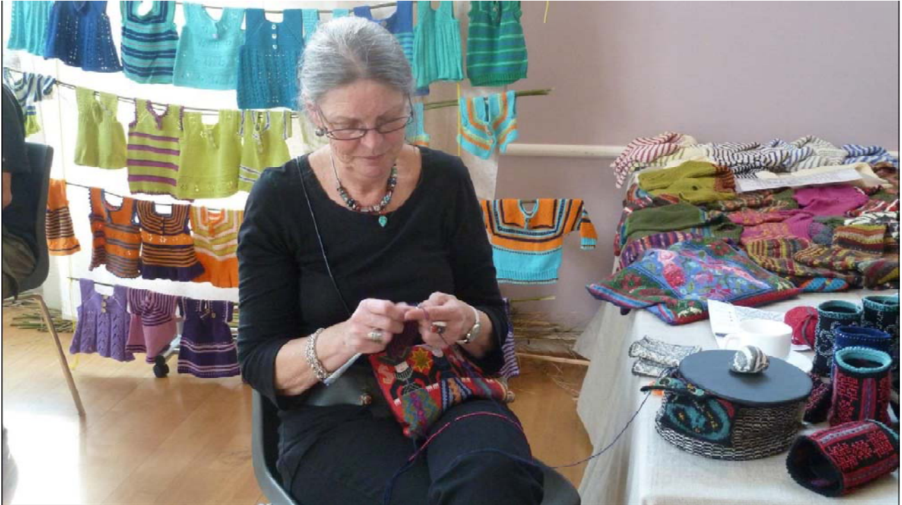
Inger viser de flotteste pulsvarmere strikket på helt tynde pinde. Åbent hus I Silkeborg 2012.