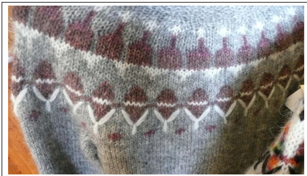
Håndstrikket islandsk sweater.