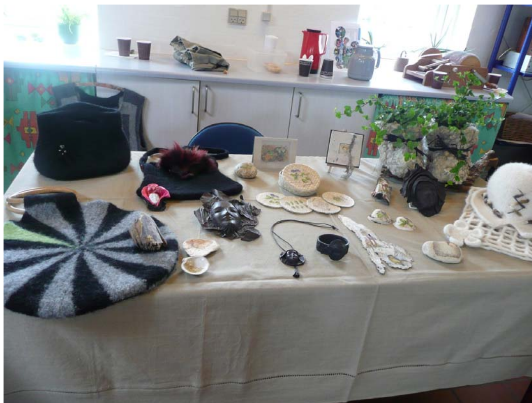
Husflid på Fjordcenteret maj 2011