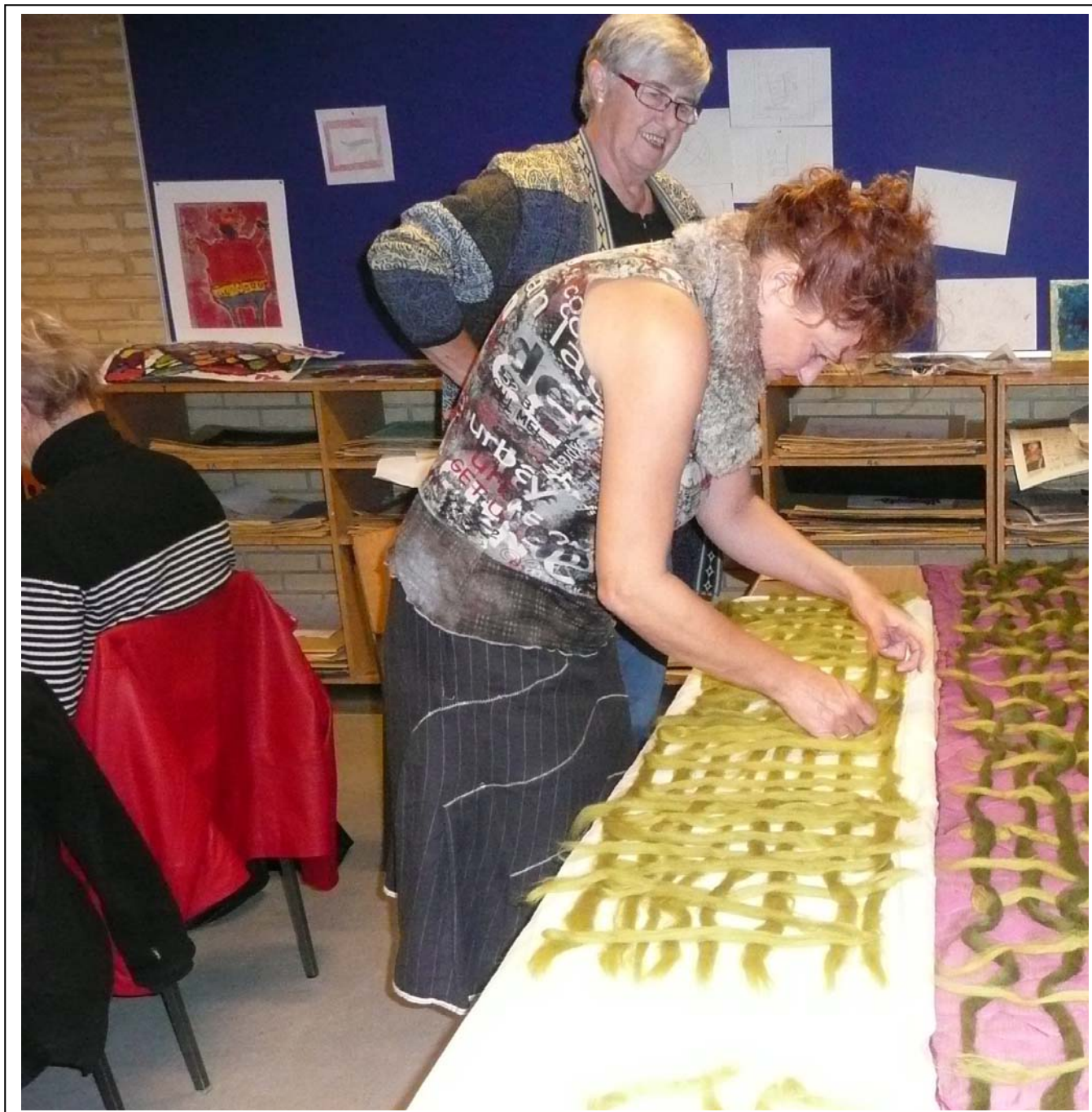
Kursus i fildede tørklæder. Hasselager Husflid