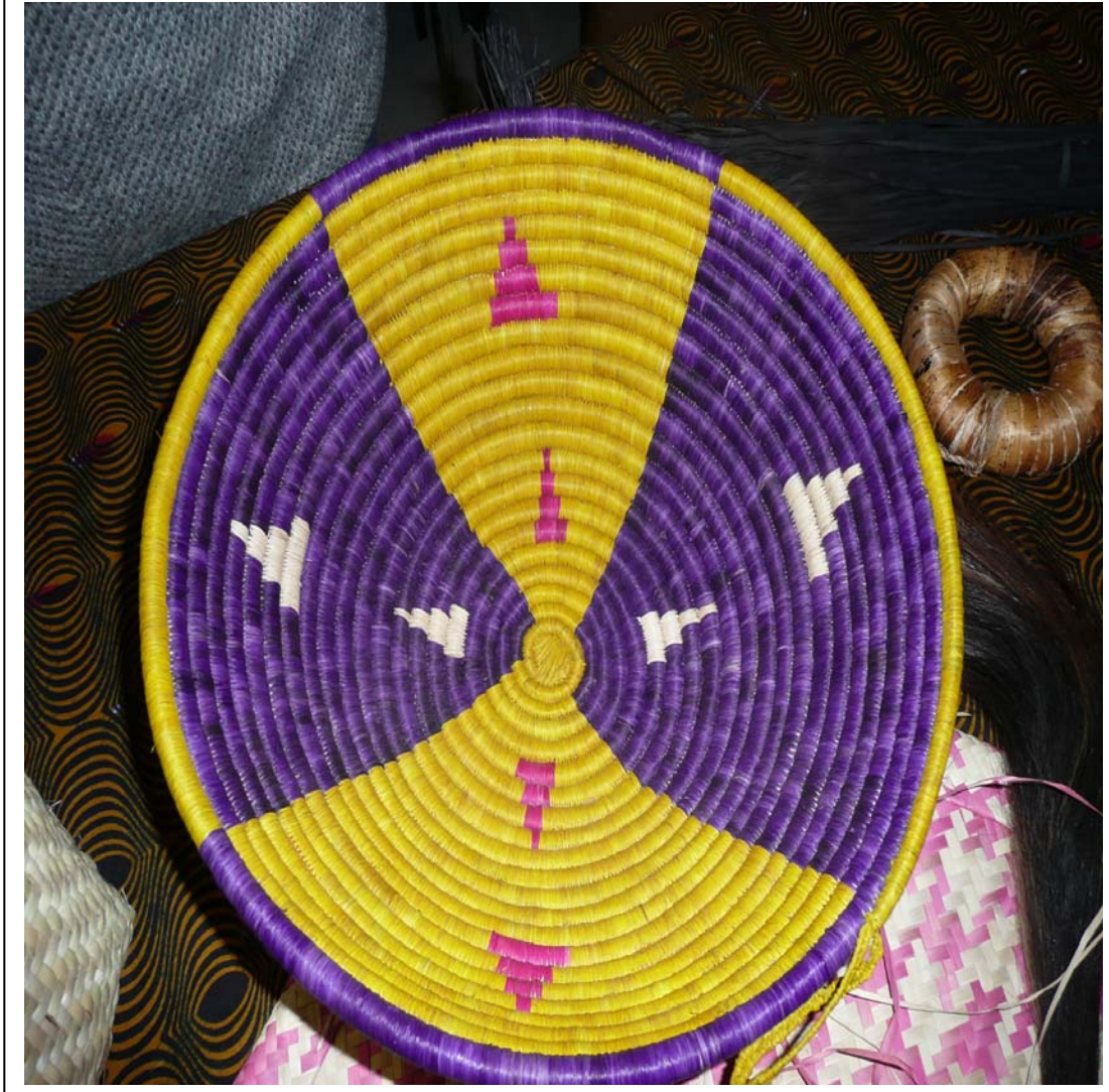
Kurv i løbbinding. Afrika.