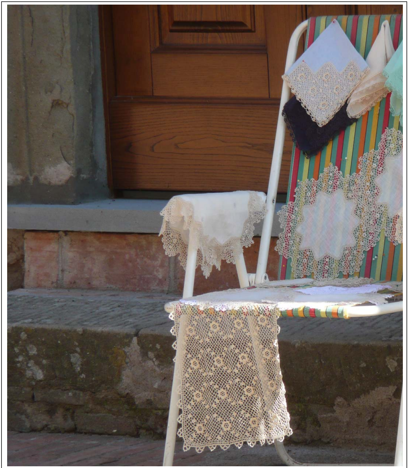
Håndarbejdsudstilling i Italien. Hæklede duge og flaconer .