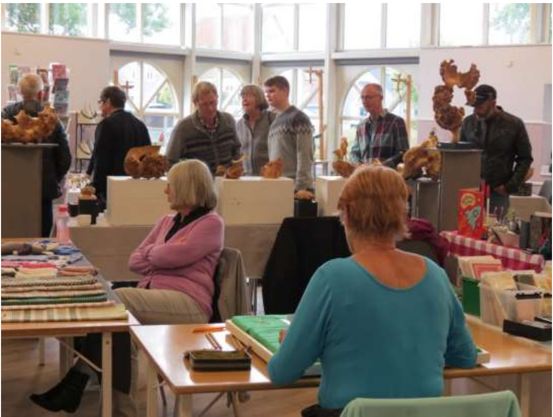
Åbent Hus i Silkeborg 29. og 30. september 2018