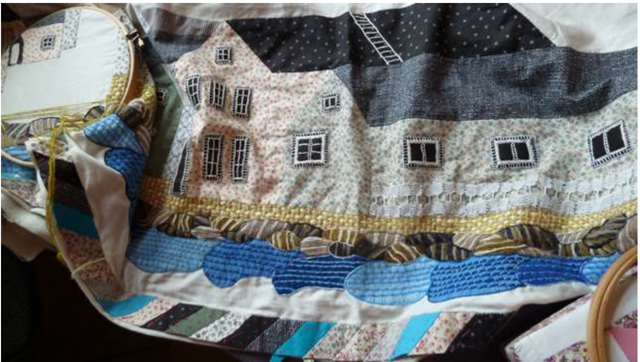
Vægstykke under opbygning